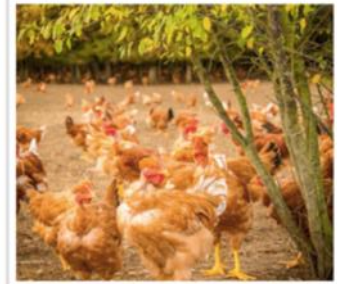
Référentiel d'audit pour l'étiquetage du bien-être animal - filière poulets de chair